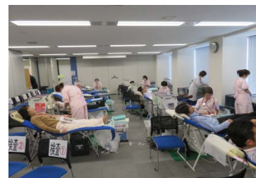
▲献血ボランティアの様子（2018年）

冬期、特に2月は、風邪やインフルエンザの流行で全国的に献血者が激減するため年間で最も血液が不足する時期であり、こうしたことから、アフラックでは毎年2月に「特定の人だけではなく、多くの人に『愛』を贈ろう！」との思いを込めて、この活動に継続的に取り組んでいます。