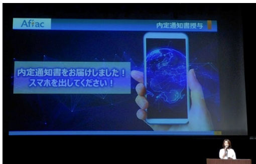
(デジタル内定通知書授与の様子①)