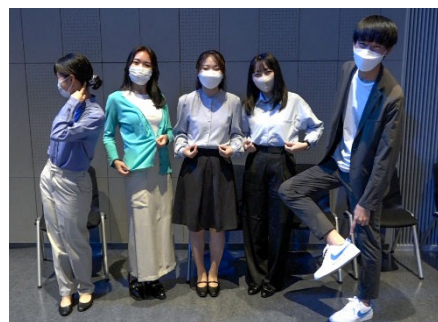
(サムシングブルーを身に着けた内定者)