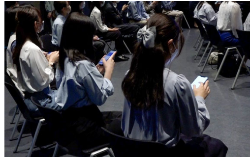
(デジタル内定通知書授与の様子②)